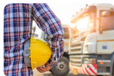
Permis C, CE, B96 et BE

Choisissez le CACES® ou le permis vous correspondant, et contactez-nous par téléphone. Nous vous transmettrons les prochaines dates.