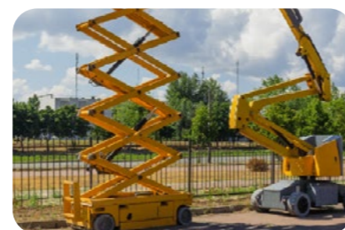
CACES® R486 Nacelles