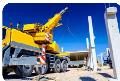
CACES® R483 Grues