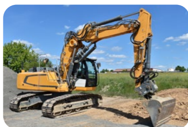
CACES® R482 Engins de chantier

Avec maformationbatiment.fr , des formations sur les permis et les CACES® sont disponibles tout au long de l'année. Vous pouvez donc vous former sur la conduite de :